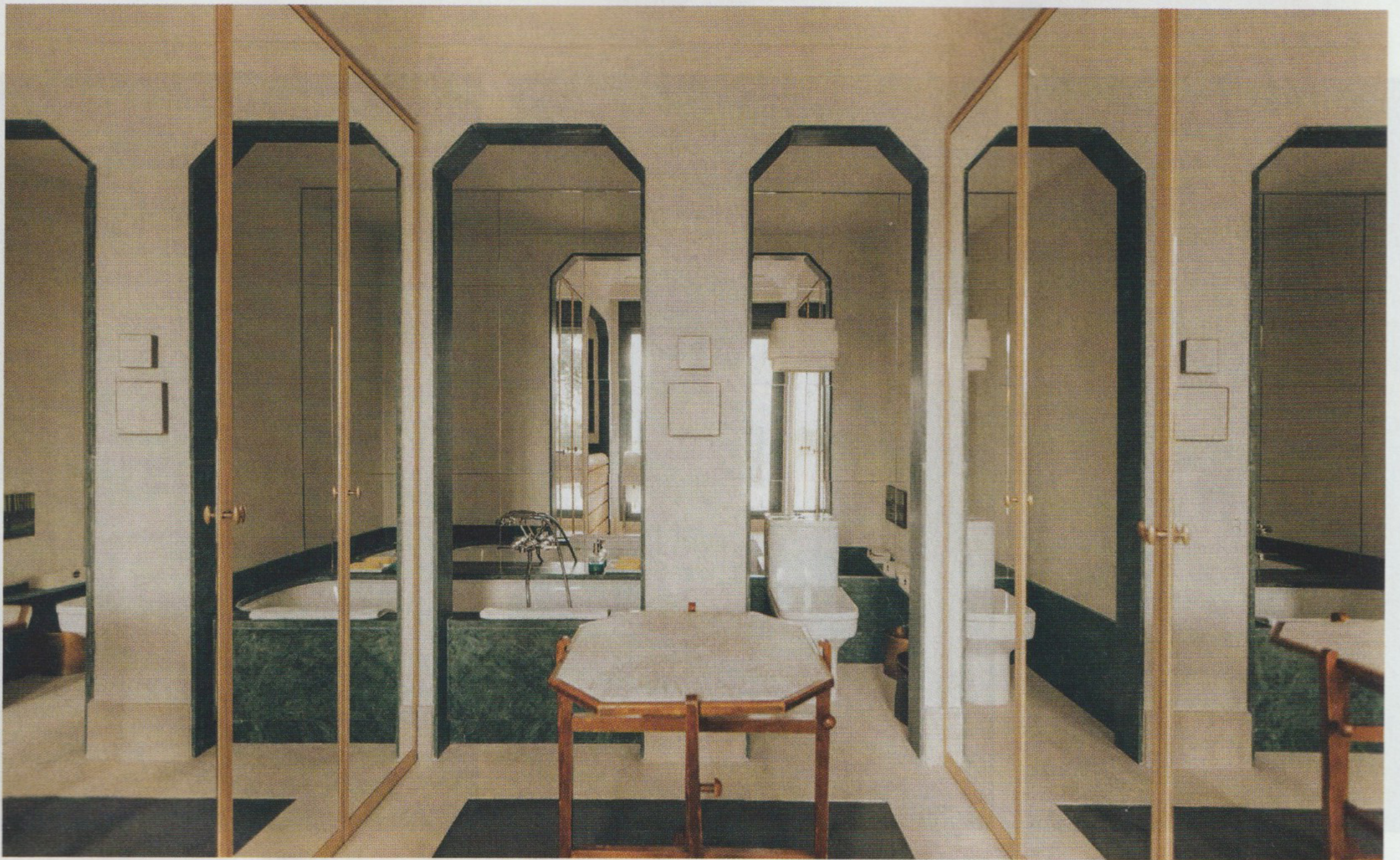
En el extraordinario cuarto de baño, embocaduras de mármol indio, armarios de roble y espejo, paredes en yeso visto y, en el centro, mesa antigua de campaña. Los apliques de escayola son de Nicole Bouwknecht.